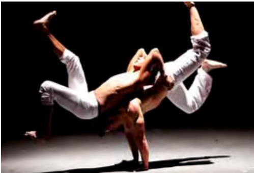
QUIEN SOY ?