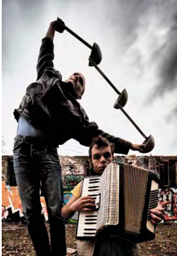
LOUCHE / PAS LOUCHE