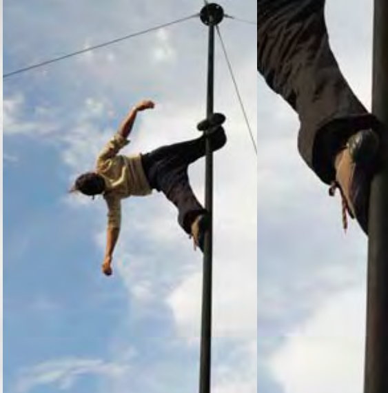
CIE MAUVAIS COTON