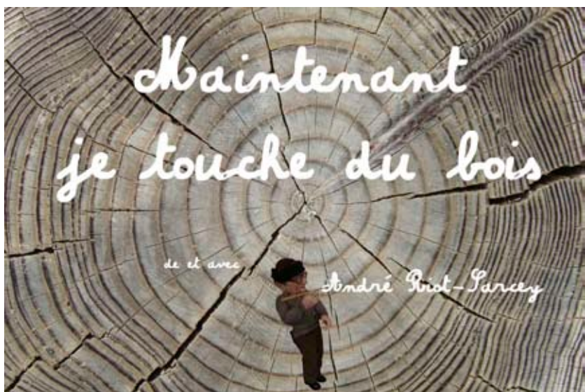
MAINTENANT JE TOUCHE DU BOIS