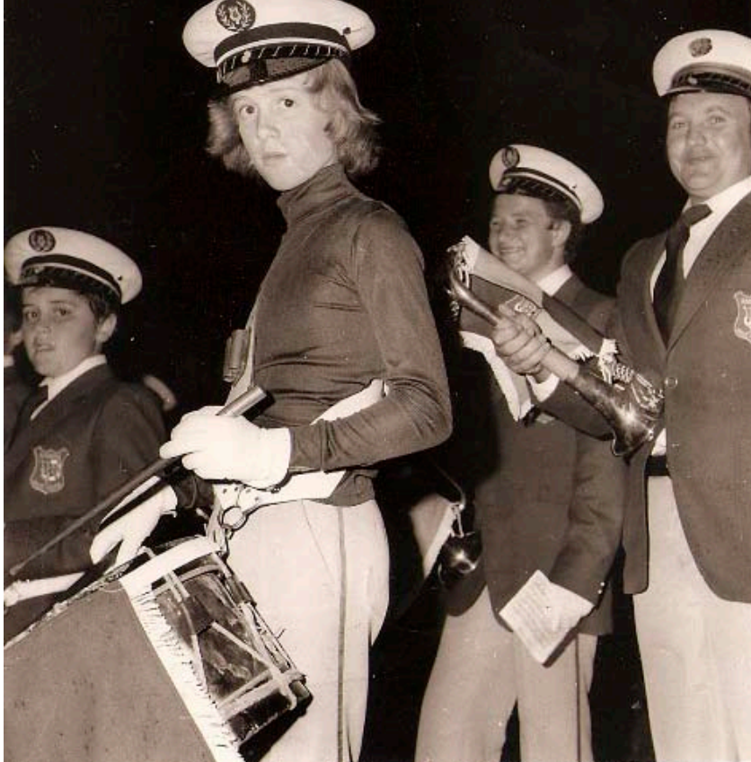
VOYAGE SUR PLACE