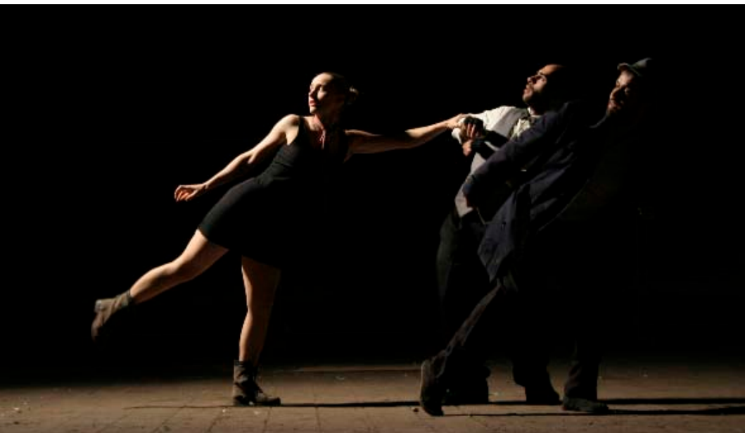
MY SELF IN THE SALAD